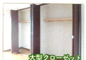
大型クローゼット

建物内に当法人運営事業所「居宅介護支援事業所」「小規模多機能型施設」「特別養護老人ホーム」があります。「広沢ヒルズ」の玄関は他の事業所と別となっています。