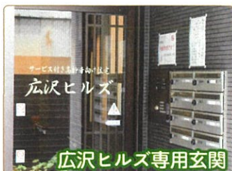
広沢ヒルズ専用玄関